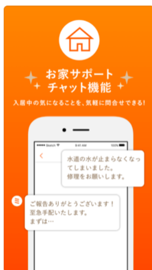
お家サポート チャット機能