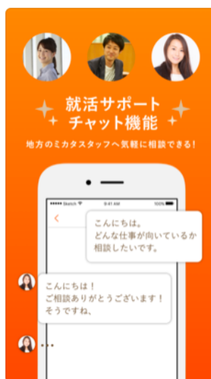
就活サポート チャット機能