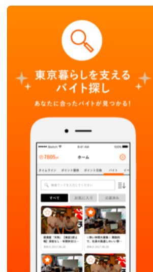
東京暮らしを支える バイト情報